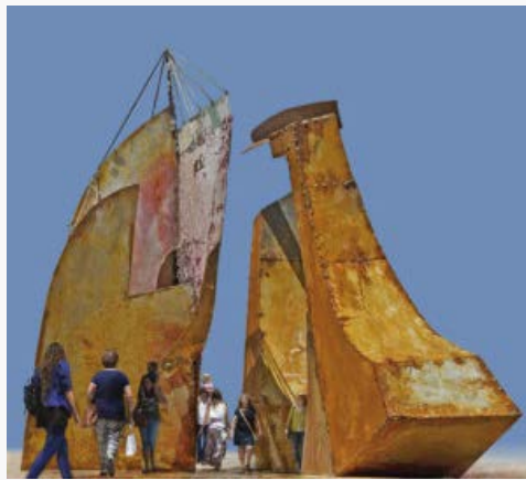
Imagen de la maqueta del monumento homenaje a Miss Whitney.