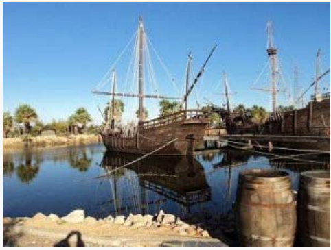
El acto recuerda la partida de las tres carabelas en 1492.

importante papel de los onubenses en la gesta del Descubrimiento de América, promover la hermandad y vínculos culturales e