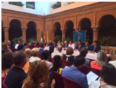
La Real Sociedad Colombina ha celebrado su sesión extraordinaria.

HBN. La Real Sociedad Colombina Onubense ha celebrado este 3 de agosto el 523 aniversario de la partida de las carabelas descubridoras del puerto de Palos de la Frontera . Como cada año en esta fecha, la entidad organiza sus sesión extraordinaria , que este 2015 ha vuelto a tener lugar en el patio mudéjar del Monasterio de la Rábida.