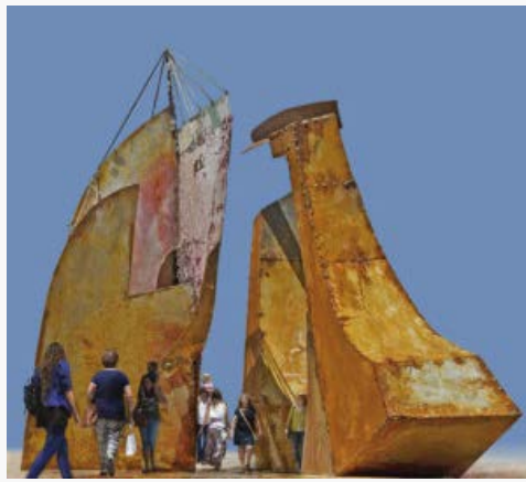
Imagen de la maqueta del monumento homenaje a Miss Whitney.